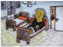
Egypt, L'Arche al Fulk Hani Zaki Habeeb