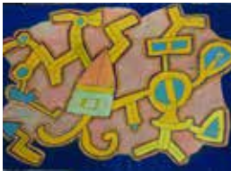
France, L'Arche L'Olivier Nicole La France