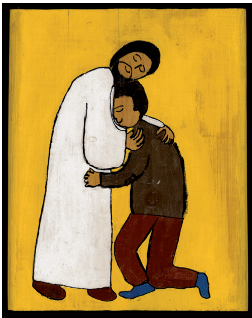
Masaichi Wakamoto 'Un fils prodigue' , acrylique sur bois, 26 cm x 22 cm, 2007