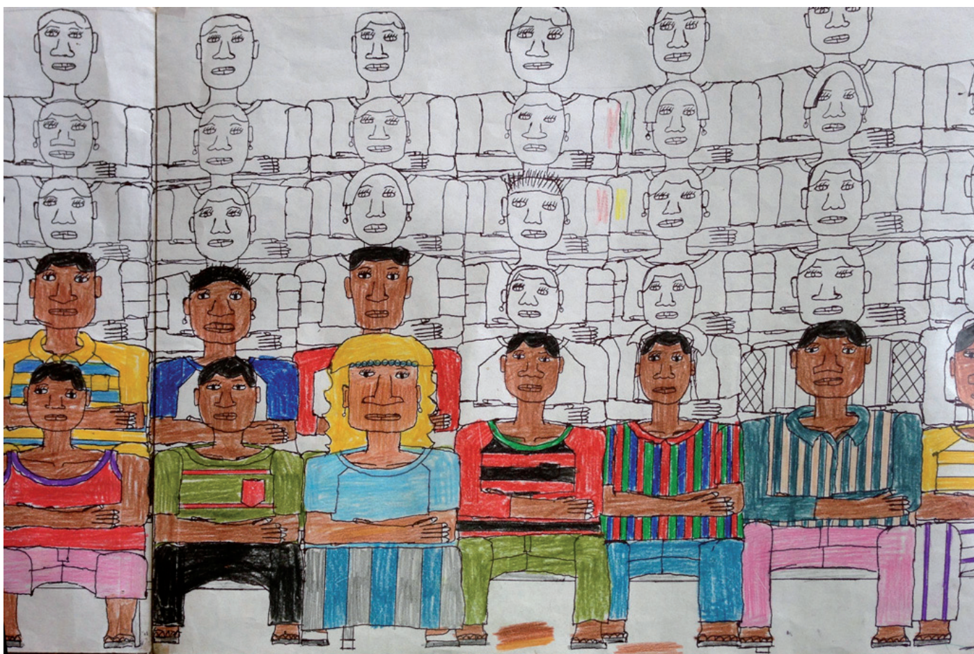
Rouamba Kouka Gildas (Kouka) 'Sans titre', crayon sur papier, 2013